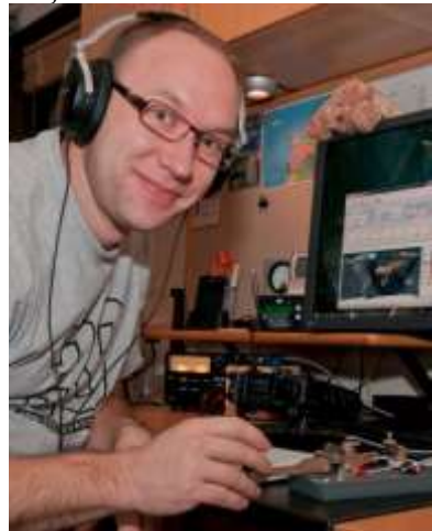
SM6VMD, Robert vid nyckeln under SKD nyårsdagen 2013.

I februari 2012 startade SK7RN en telegrafiavrostning på 80 meter som gick en timme varje tisdag och torsdag. Detta passade mig utmärkt och fungerade som morot för mig att nöta in hörmottagning. Vi var ett glatt och trevligt gäng som tutade ihop vid så gott som varje tillfälle.