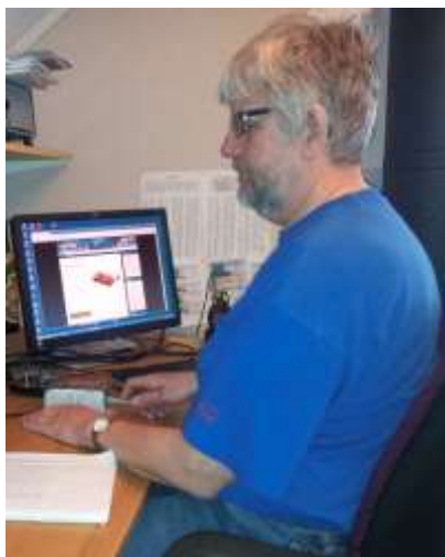
SM6TPJ Mats i shacket

När SOCWA startade fanns modet att börja prata med hjälp av de långa och korta. Det går inte så fort med handpumpen, det blir lite felsändningar och jag missar lite i mottagningen ibland, men det FUNKAR! Ingen tvekan om att färdigheten ökar efterhand även om jag för tillfället, efter ett 50-tal SOCWA-qso:n, tycker att jag nått en plåtå där varken sändning eller mottagning förbättras. Det är väl enligt någon slags normal inlärningskurva och förhoppningsvis kommer det gå bättre igen.